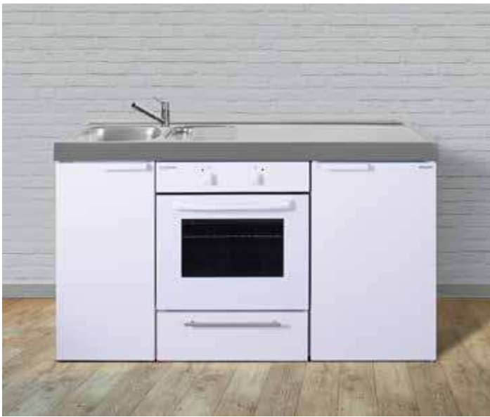
Bild: MKB 150 ohne Kochfeld