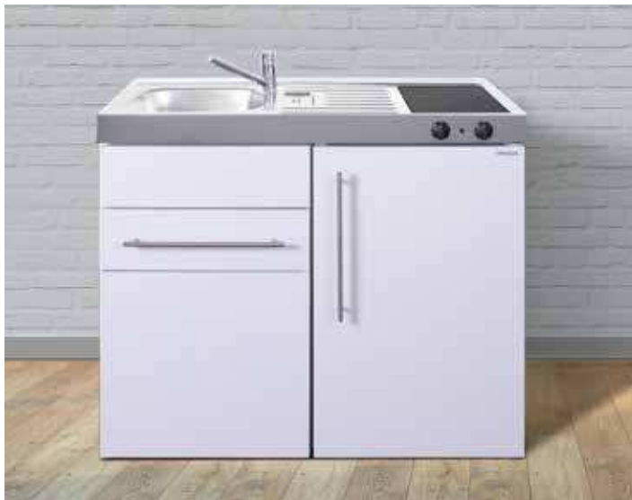
Bild: MP 100 S - Glaskeramik