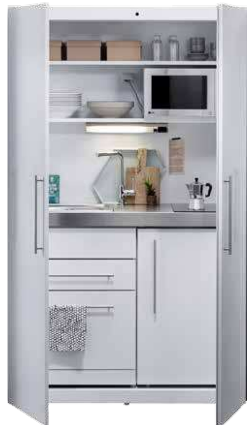
mit Vollausrüstung